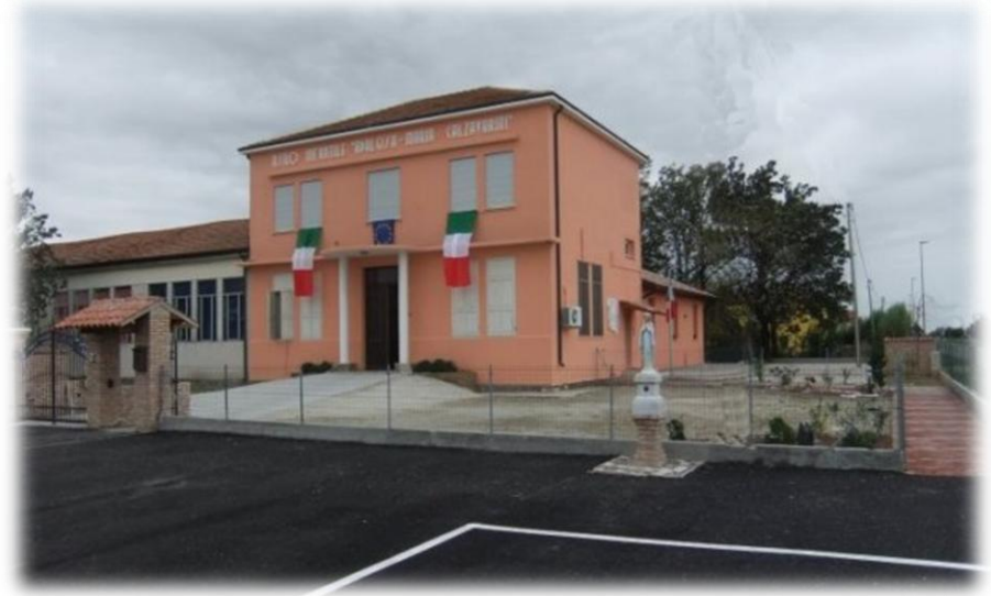
La nostra Scuola